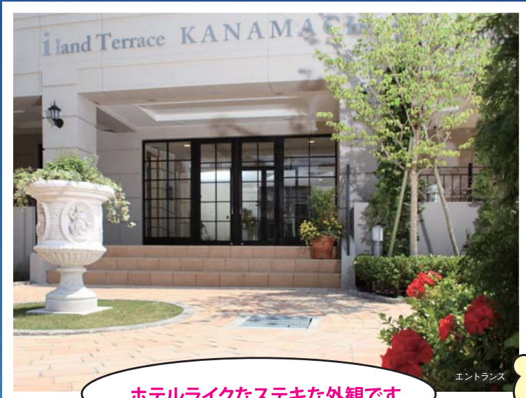
ホテルライクなステキな外観です